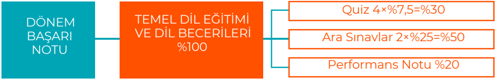
Şekil 2. Dönem içi başarı notunun hesaplanması

İngilizce Hazırlık Sınıfında ölçme faaliyetleri 100 tam puan üzerinden değerlendirilir. Bir dönemde akademik takvimde belirtilen tarih aralığında 4 habersiz quiz ve 2 ara sınav yapılmaktadır. Başarı puanı ve dönem ortalaması aşağıda belirtilen şekilde hesaplanır